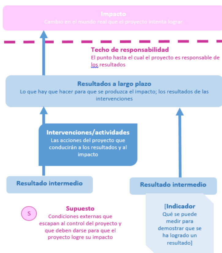
FIGURA 1 UN EJEMPLO VISUAL DE LOS COMPONENTES CLAVE DE UNA TEORÍA DEL CAMBIO CON LAS DEFINICIONES ADAPTADAS DE DE SILVA ET AL. 2014 7

supuestos que debe haber para que el programa logre su impacto y el techo de responsabilidad que indica qué parte de la Teoría del Cambio es responsabilidad del programa o la política. Las partes interesadas son guiadas a través de este proceso durante los talleres y desarrollan un mapa de la Teoría del Cambio que puede utilizarse para guiar el desarrollo, la implementación y la evaluación del programa 7 , incluida la elaboración de indicadores.