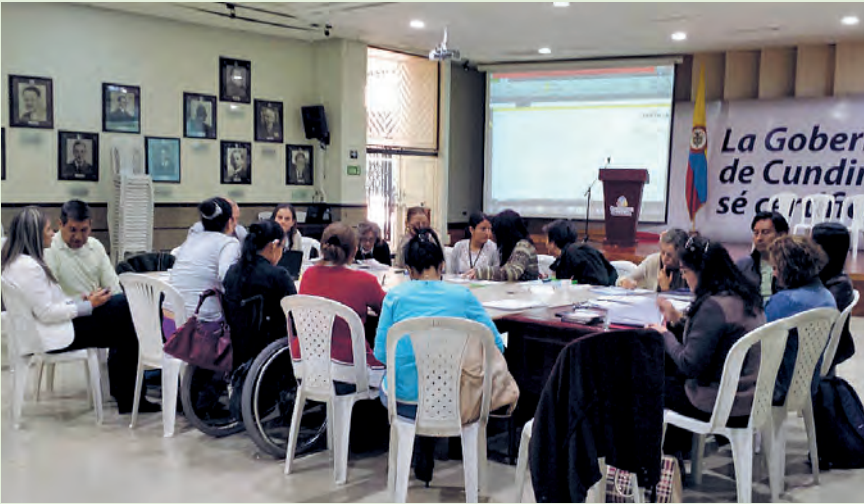
La asistencia técnica europea se traduce en misiones o viajes de estudio de expertos en discapacidad.