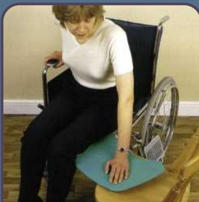
TABLA DE TRANSFERENCIA