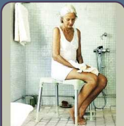
ASIENTO PARA DUCHA

Los Productos de apoyo favorecen la autonomía en las actividades diarias, las relaciones sociales y la calidad de vida