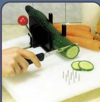
TABLA PARA PREPARAR ALIMENTOS