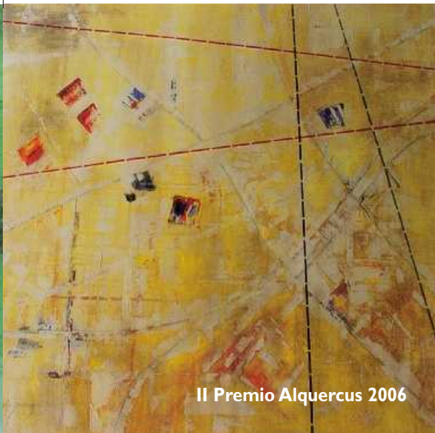
II Premio Alquercus 2006