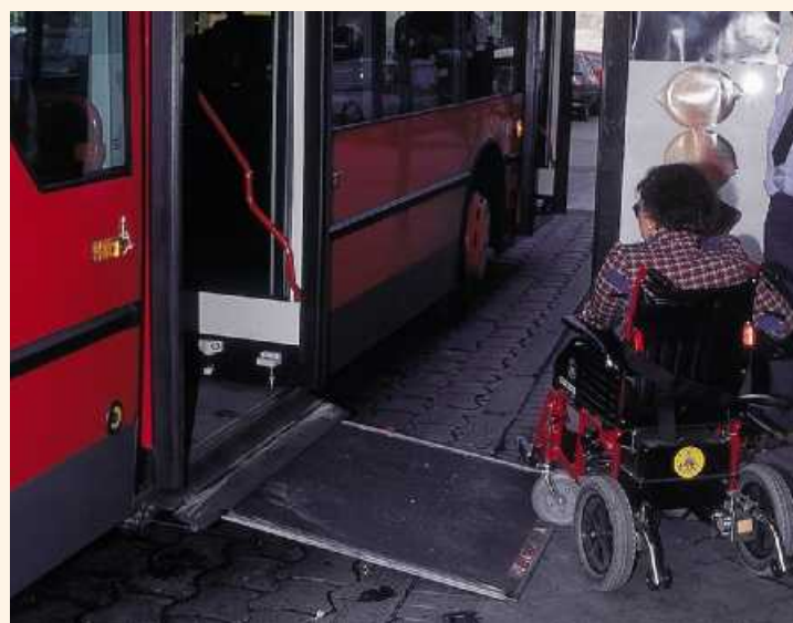
Una usuaria en silla de ruedas se dispone a subir a un autobús adaptado

Por las condiciones geográficas de la propia Autonomía, el medio rural será una de las principales dianas, de suerte que este plan se convertirá, además, en una forma de eludir el aislamiento. Por ahora, un total de 51 ayuntamientos de entre 10.000 y 50.000 habitantes podrán habilitar este servicio de transporte, que incluye, además, el acompañamiento social para