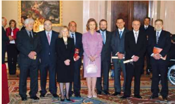
Los galardonados posan junto a S.M. La Reina, la secretaria de Estado de Servicios Sociales, Familias y Discapacidad, Amparo Valcarce, y el presidente de la Junta de Extremadura, Juan Carlos Rodríguez Ibarra

En relación a los municipios de entre 10.000 y 100.000 habitantes, el municipio de Lugo fue premiado