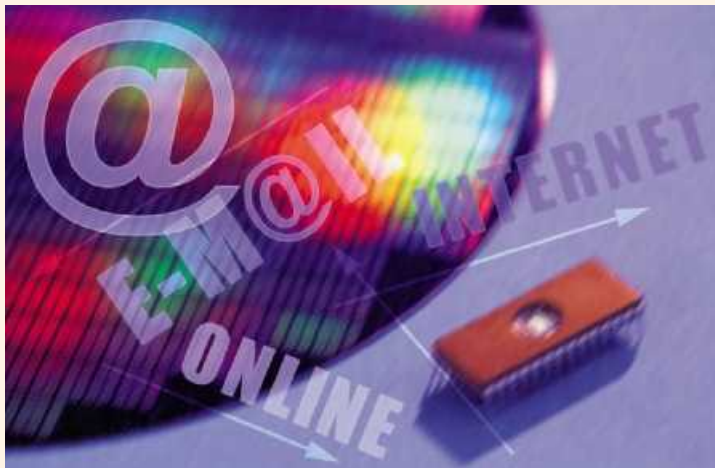
El Aula Abierta sobre tecnologías y autonomía personal es una iniciativa del IMSERSO y el IBV

● Accesibilidad integral: cómo hacer accesibles los productos y los entornos, dirigido a proporcionar una introducción práctica a la accesibilidad integral, transmitiendo las bases metodológicas para diseñar y modificar