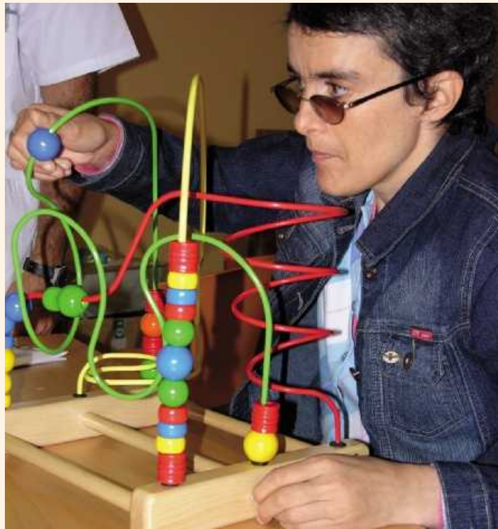
Sesión de rehabilitación psicomotriz en el Centro de Bergondo

El Plan de Acción para Mayores que recibirá más de 70 millones de euros, revela un crecimiento del 25% respecto al