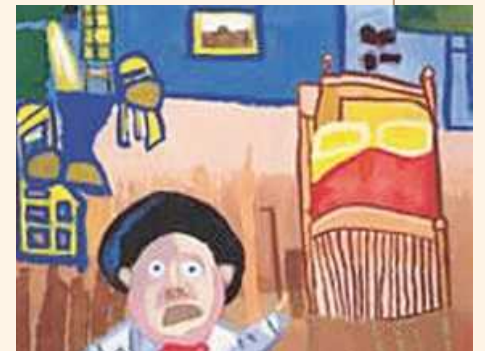
Cuadro: “El cuarto de Van Gogh”

La calidad de las obras de los artistas de la EMAD ha sido reconocida por grandes pintores mexicanos de la talla de Anguiano, Cauduro, Soriano y Felguérez, entre otros, quienes señalaron que la pintura es un reflejo del carácter de cada uno de los jóvenes. A través de las actividades impartidas EMAD los jóvenes artistas se sienten productivos, útiles, y en sus obras vuelcan todos sus estados de ánimo, materializan su potencial artístico y literalmente hacen de sus trabajos una “poesía pictórica”.