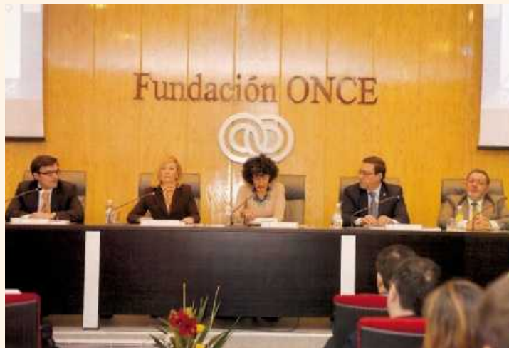
La ministra de Educación y Ciencia, durante su intervención

Se trata de una completa guía de actuaciones para impulsar un programa de accesibilidad universal en el sistema educativo universitario. El llamado “Diseño para todos” (Design for all) centra su actividad en la bús-