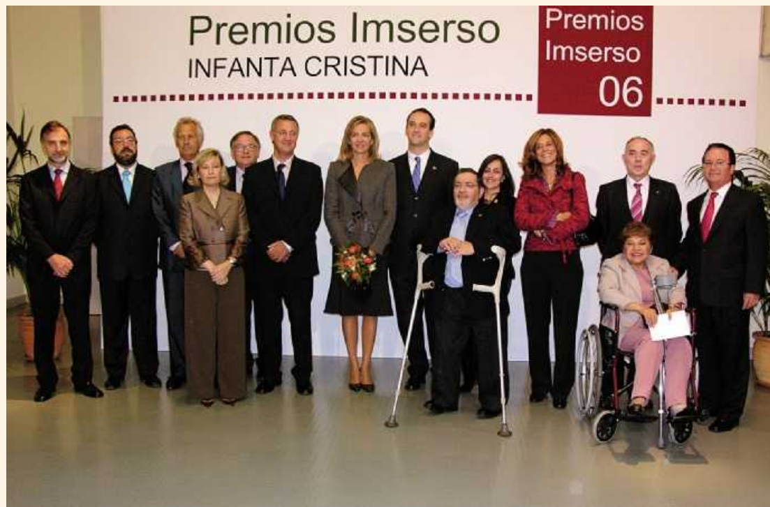
La Infanta Cristina posa con los premiados en la edición del 2006

El Premio a Estudios e Investigaciones Sociales con dotación hasta los 15.000 euros, premiará la labor de realizadores de estudios o investigaciones cuya contribu-