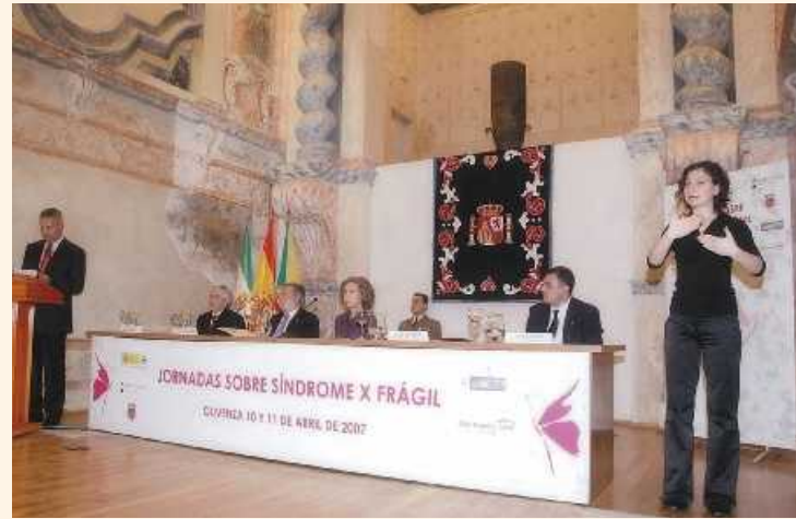
La Reina Doña Sofía presidió las Jornadas celebradas en Olivenza

Los familiares de las personas afectadas por este síndrome