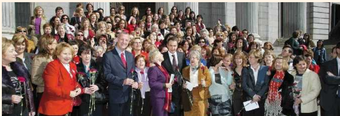
El presidente del Gobierno, José Luis Rodríguez Zapatero, y el ministro de Trabajo y Asuntos Sociales, Jesús Caldera, tras la aprobación de la Ley en el Congreso de los Diputados

Hacer efectivo el principio de igualdad de trato y la eliminación de todo tipo de discriminación contra la mujer en cualquier ámbito de la vida o actuación pública o privada es el objetivo de esta Ley aprobada sin ningún voto en contra, por el Congreso de los Diputados.