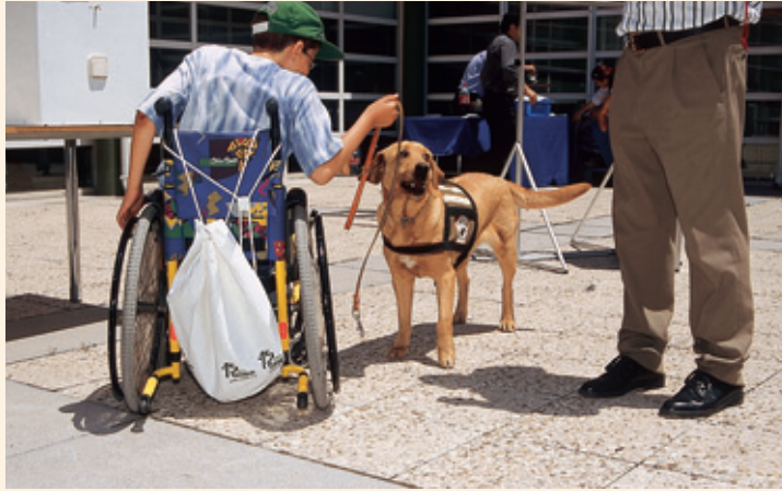
Joven con perro guía en el CEAPAT