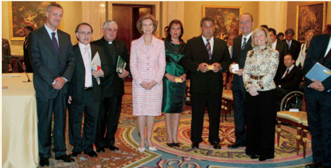
S.M. La Reina Doña Sofía, Jesús Caldera y Amparo Valcarce junto a los galardonados

La Reina Doña Sofía presidió la entrega de los Premios de ámbito nacional e iberoamericano que llevan su nombre, de Rehabilitación e Integración de las Personas con Discapacidad y de Accesibilidad de Municipios en su edición del 2005, que concede anualmente el Real Patronato sobre Discapacidad.