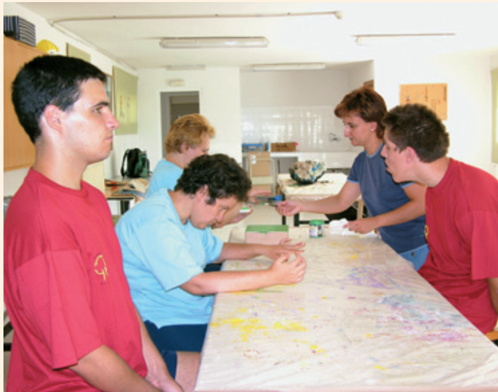
Alumnos con discapacidad intelectual en un taller de manualidades

Un problema de especial relevancia, según el informe, son los casos de autolesión e intento de suicidio entre los