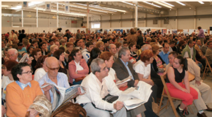
Un momento de la clausura, con familias de toda España

Uno de los temas más controvertidos fue la llamada Ley de Dependencia. FEAPS manifiesta que el Proyecto de Ley contempla aspectos fundamentales compartidos por los participantes en este Congreso, y valora de manera