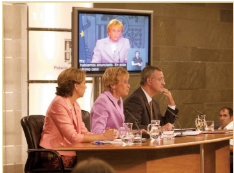
Intervención de la vicepresidenta primera del Gobierno, M a Teresa Fdez. de la Vega, durante su intervención en la rueda de prensa, tras la aprobación del Anteproyecto de Ley de la Lengua de Signos por el Consejo de Ministros

Como novedad, las administraciones educativas podrán ofertar modelos educativos bilingües para estos alumnos, e incluir en los planes de estudio el aprendizaje de dicha lengua como asignatura optativa para el conjunto de los estudiantes.