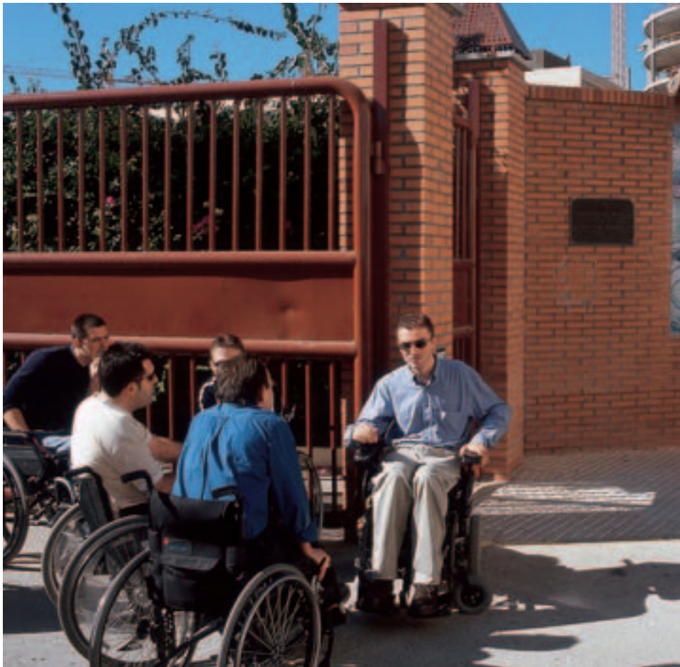
Las personas con discapacidad, como cualquier otro ciudadano, son capaces de autodefinir sus necesidades y los procedimientos para satisfacerlas

casi ha convertido en categoría industrial, supeditada a una legión de expertos, técnicos y operarios que aplicando sus métodos de intervención y control social, soportados por infinidad de instrumentos políticos, perpetúan modelos fracasados de integración. Ni tan siquiera el tan pregonado advenimiento de la sociedad abierta y tecnologizada que celebraba el sistema ha traído una menor exclusión social y económica.