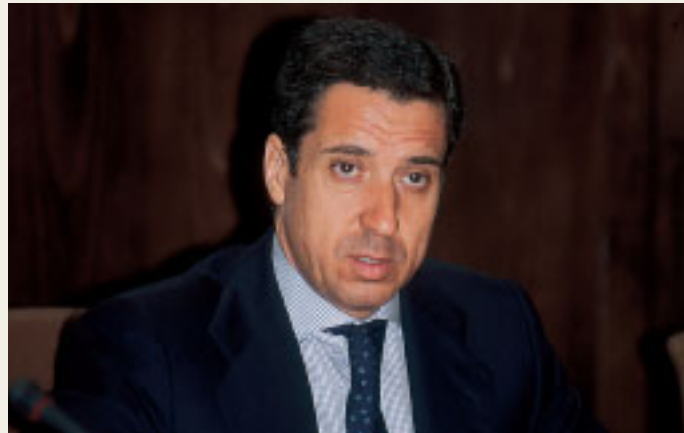
Eduardo Zaplana, ministro de Trabajo y Asuntos Sociales y portavoz del Gobierno

Mariano Rajoy, nuevo secretario general del Partido Popular, sale del Gabinete y se presentará como candidato a la Presidencia del Gobierno en las próximas elecciones generales. Por su parte, Rodrigo Rato sigue desempeñando la cartera de Economía y el nuevo portavoz del Gobierno, la de Trabajo y Asuntos Sociales.