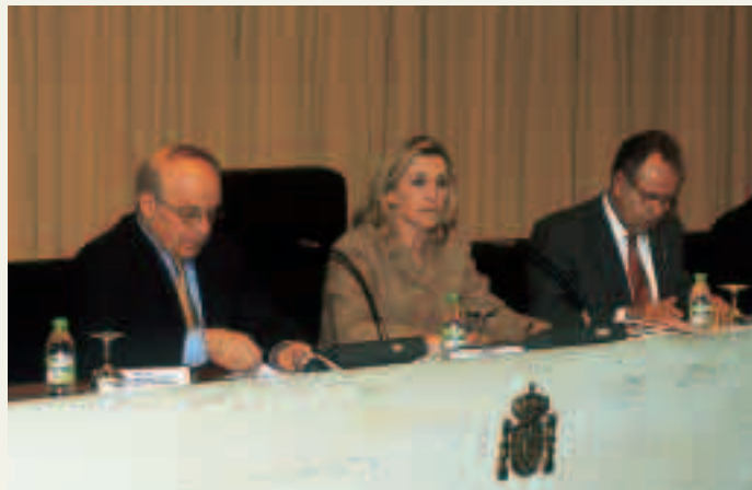
La secretaria general de Asuntos Sociales, Concepción Dancausa, junto al director general del IMSERSO, Alberto Galerón, y el representante del CSIC, Pedro Aparicio, durante el acto.

El Sistema de Información Virtual para mayores es otra de las contribuciones que aporta nuestro país a la celebración de la II Asamblea Mundial sobre el Envejecimiento y constituye, en la actualidad, el