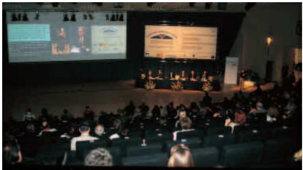
El Palacio de Congresos de Madrid albergó el Congreso Europeo sobre las Personas con Discapacidad del 20 al 23 de marzo de 2002.

Lograr la meta de la igualdad en el acceso y la participación requiere que los recursos deben ser canalizados de tal forma que refuerce la capacidad de participación de la persona con discapacidad y su derecho a vivir de forma independiente. Numerosas personas con discapacidad requieren de servicios de apoyo en sus vidas cotidianas. Estos servicios deben ser servicios de calidad que recojan las necesidades de personas con discapacidad, no debiendo ser una fuente de segregación, y debiendo promover la integración en la sociedad. Esta posición está de acuerdo con el modelo social europeo de solidaridad; un modelo que reconoce nuestra responsabilidad colectiva solidaria hacia aquellos que requieren ayuda.