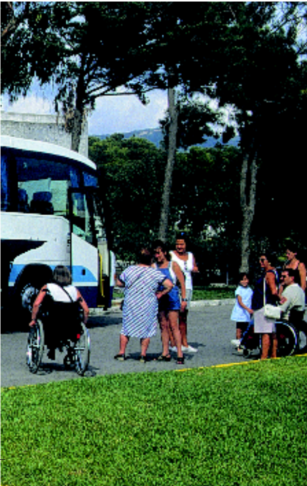
En el proyecto de transporte adaptado, dirigido a solventar los problemas de desplazamiento, participan gran número de voluntarios.

emocional, permite a los usuarios contactar con una central que funciona 24 horas al día para dar respuesta a cualquier situación de emergencia que pudiera producirse, mantener una agenda personalizada y llevar a cabo el seguimiento de los usuarios. En este sentido, cabe destacar el Proyecto CONFIDENT proyecto europeo en el que está participando Cruz Roja Española junto a operadores de telefonía, centros de investigación, empresas de telecomunicaciones y usuarios finales, y que está generando grandes expectativas debido a su gran potencial en la gestión y provisión de servicios para personas con discapacidad. Basado en las emergentes redes de comunicación de banda ancha, se está trabajando en el diseño de