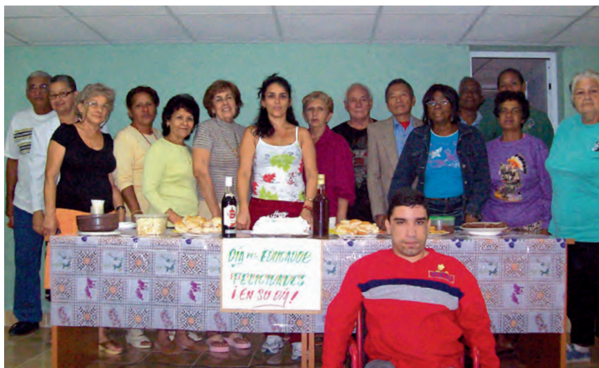
Celebración del día del educador.

Se instrumentan cursos de continuidad para los mayores egresados del curso básico, la apertura de nuevas sedes en diversos territorios en Consejos Populares de residencia con alta concentración de personas de la tercera edad, Hogares de Ancianos Institucionalizados, y Centros Penitenciarios previo estudio diagnóstico para la adecuación de programas y selección de especialistas en el desarrollo de los módulos.