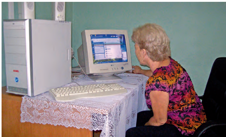
Participando la cibernética.

Debe destacarse que Villa Clara es el territorio más envejecido del país desde hace varios años y en el 2010 alcanzó la cifra de 21,3% de su población con edades de 60 años y más. La esperanza de vida al nacer es la segunda más elevada del país alcanzando en el período 2005-2007 la cifra de 79,13 años, superada solo por Las Tunas ”