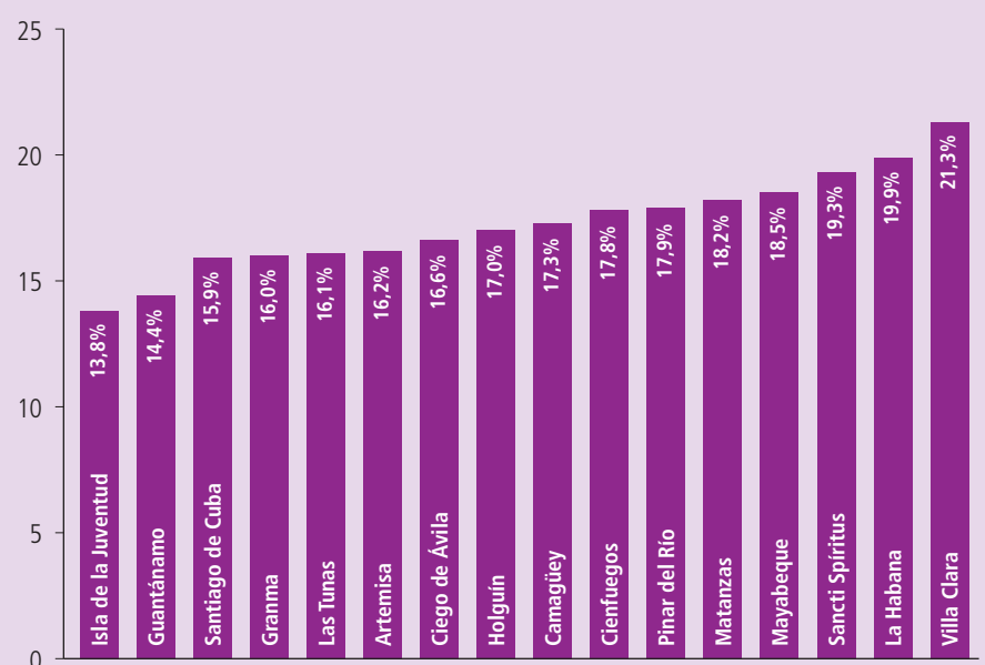
Gráfico 2. Porcentaje de población de 60 años y más por provincias, año 2010

Se han dado pasos importantes desde la Universidad del Adulto Mayor, junto a los Programas de Salud, y los GeroClub de Computación dirigidos a personas de este grupo de edades mayores de sesenta años, los cuales se estimulan con el aprendizaje ofrecido sin costo alguno por profesores e investigadores interesados en el tema de envejecimiento y vejez.