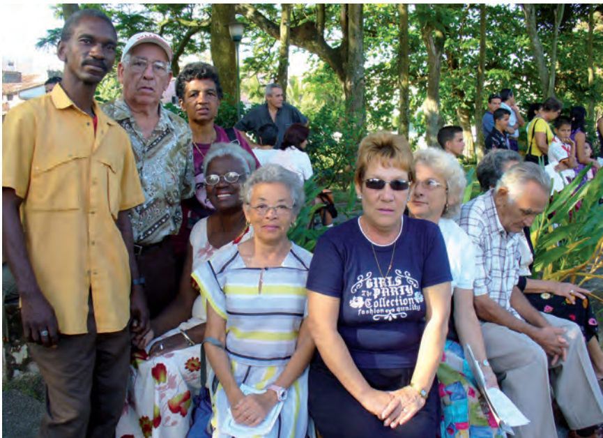
Grupo de participantes en la Cátedra del Adulto Mayor.

Texto y fotos | Dra. C. Milagros Román González [Presidenta Cátedra Adulto Mayor, Universidad Central "Marta Abreu" de Las Villas. Cuba]