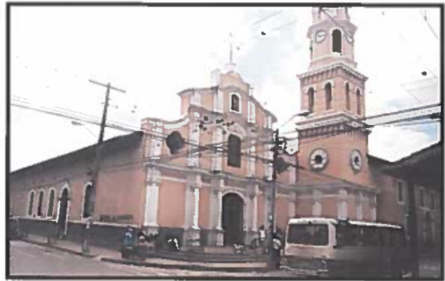
Santa Cruz de la Sierra (Bolivia) fue el escenario elegido para reunir a los representantes iberoamericanos.

También aquí, con la vista puesta en el Foro Mundial de ONG's sobre el envejecimiento, que se celebrará en Madrid en abril de 2002, y al cual se someterán las conclusiones, se obtuvo como resultado un documento que contiene las propuestas surgidas de las exposiciones, debate y trabajo en co-