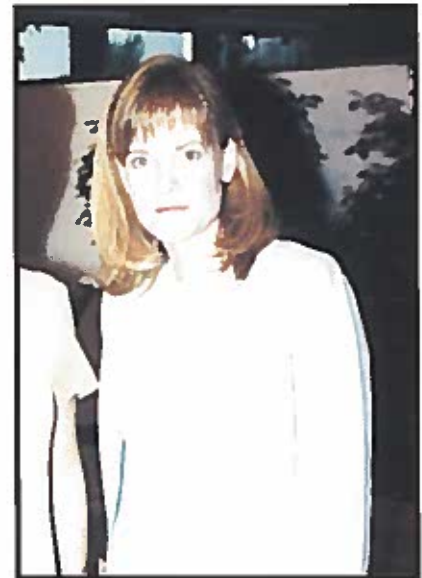
Virginia G. de Quiroga, Primera Dama de Bolivia.

— Es muy difícil llegar a un nivel de protección de la totalidad. Prácticamente, es utópico en un país tan pobre como Bolivia, pero creo necesario hacer un esfuerzo para llegar hasta las áreas rurales,