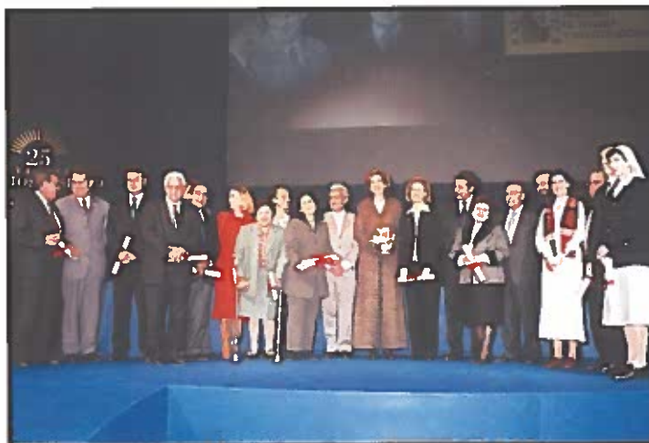
Foto general de los premiados en el veinticinco aniversario de estos galardones, acompañados del Ministro de Trabajo y Asuntos Sociales español, Juan Carlos Aparicio.

bre Sistemas de Salud en ESSALUD, representando a este Organismo ante el Consejo Nacional de Integración de las Personas Mayores de su país.