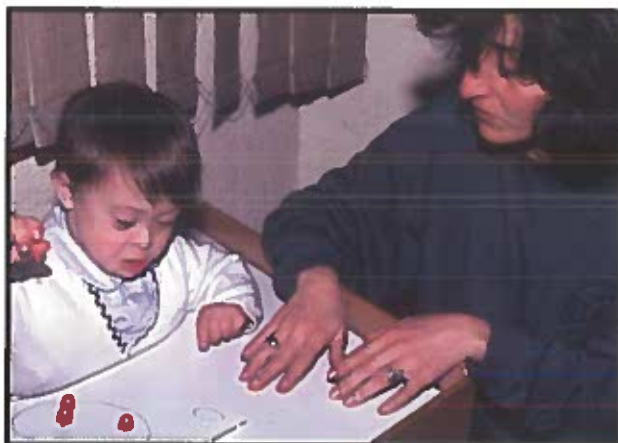
El programa pretende garantizar el diagnóstico, tratamiento y rehabilitación funcional de la población con discapacidad.

Es importante resaltar que estas acciones van dirigidas, especialmente, a la población vinculada; es decir, a las personas sin capacidad de pago que no han ingresado, todavía, en el Régimen Subsidiado, así como a los afiliados a