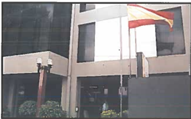
El apoyo organizativo del Centro Iberoamericano de Santa Cruz (CIF) de la AEIC hizo posible la realización de estas jornadas.

vechó para hacer un repaso a las razones que han movido a las Naciones Unidas para convocar esta nueva Asamblea sobre el Envejecimiento: los cambios producidos desde la celebración de la I Asamblea, hace veinte años; el espectacular crecimiento de la población mayor de sesenta años,