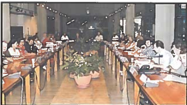
Los representantes de organizaciones no gubernamentales iberoamericanas de y para los adultos mayores expresaron su deseo de que su voz sea escuchada en Madrid.

Por su parte, los dos días siguientes, 22 y 23 de noviembre, tuvo lugar la reunión preparatoria de organizaciones no gubernamentales, también con la participación de varios representantes de organismos internacionales, de la Comisaría del Comité Organizador de la II Asamblea, del IMSERSO y de RIICOTEC.