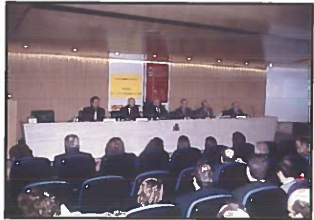
La nueva clasificación de las discapacidades se presentó en la sede central del IMSERSO en Madrid.

Con el transcurso del tiempo, y sus consiguientes avances y cambios, comenzaron a surgir críticas a la Clasificación Internacional de Deficiencias, Discapacidades y Minusvalías; unas se centraban en el sistema de clasificación y categorización de las secuelas de la enfermedad, y