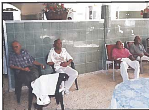
Adultos mayores del Hogar de Ancianos San Francisco de Asís, de Santo Domingo (República Dominicana).

Por todo ello, una política sobre dependencia tiene que considerar las múltiples necesidades a las que se enfrentan los adultos mayores, para lo que habrá que generar acciones diferenciadas. La experiencia española puso de manifiesto, respecto del roles del Estado, la familia