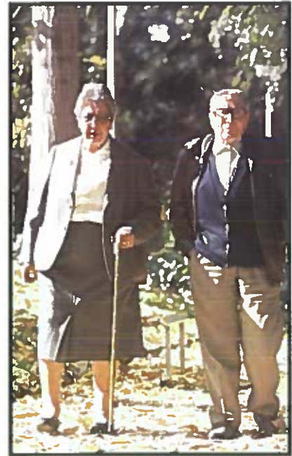
Uno de los objetivos del curso fue profundizar en las cuestiones relacionadas con los problemas de las personas mayores.

› REPÚBLICA DOMINICANA: Se convocarán encuentros intercomunitarios con personas mayores, y se fortalecerán las redes comu-