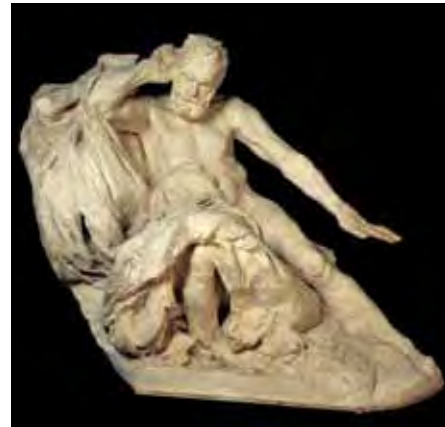
“La musa trágica. 1890”.

“No hay más carácter, es decir, aquello que no ofrece ninguna verdad exterior ni interior. Es feo en el Arte lo que es falso, lo que es artificial, lo que trata de ser bonito o hermoso en lugar de ser expresivo, lo que es amanerado y preciosista, lo que sonríe sin