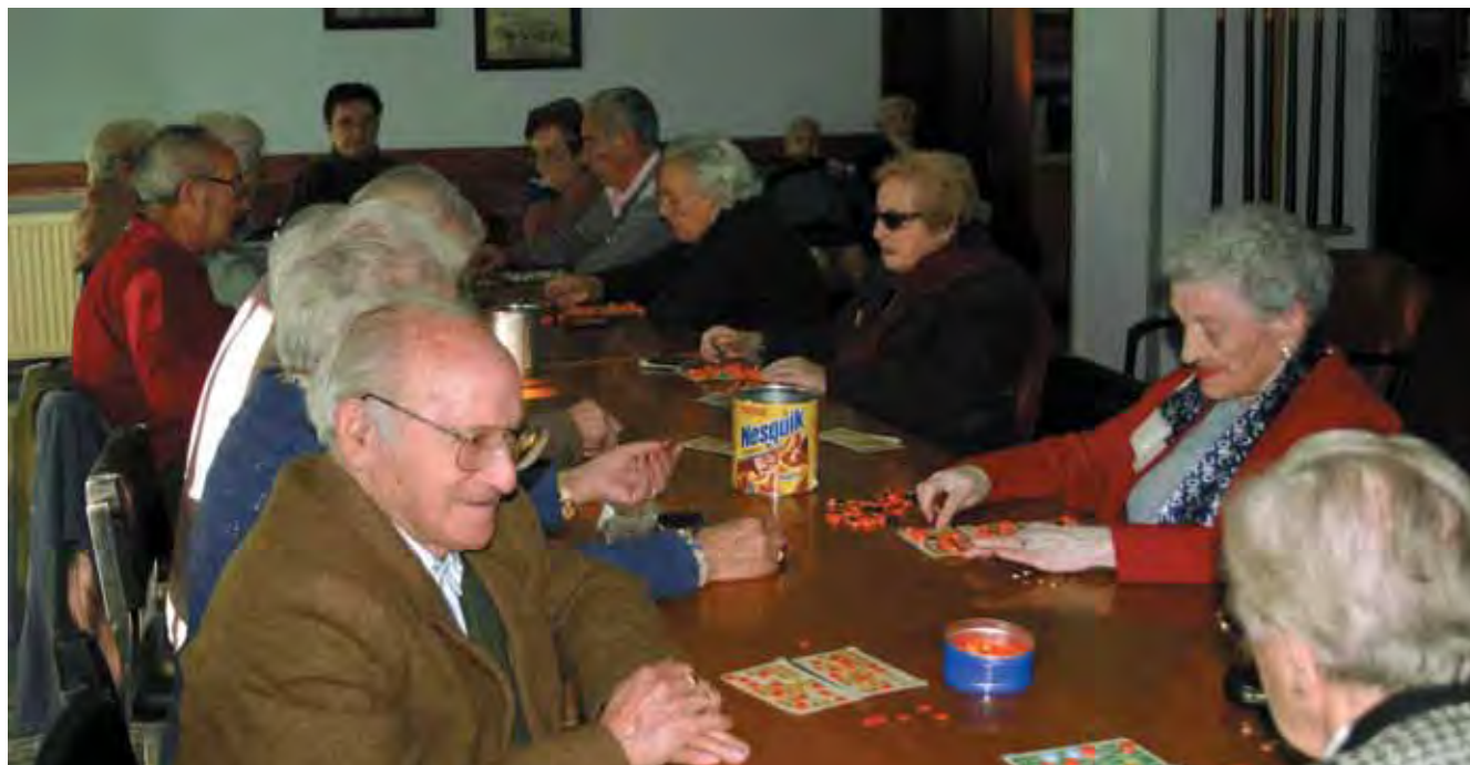
La convivencia en los centros residenciales potencia el desarrollo personal.

E l Instituto de Mayores y Servicios Sociales gestionará la nueva Residencia para personas mayores en la Ciudad Autónoma de Melilla que ya ha iniciado las obras de construcción que culminarán en junio de 2006.