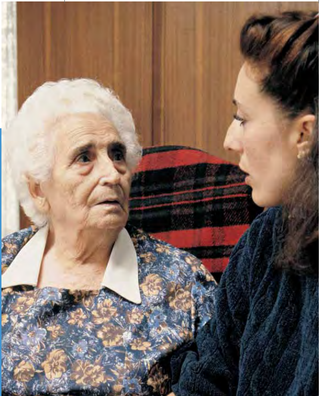
El trato personalizado y humano es altamente valorado por los mayores.

La provisión de un programa de promoción de salud y de asistencia sanitaria preventiva es uno de los 10 elementos fundamentales que deben incluir los Servicios Especializados para Personas Mayores, según la Sociedad Británica de Geriátría. Estas recomendaciones, publicadas en el Observatorio de Mayores del IMSERSO, son de gran utilidad, tanto para los mayores mismos, como para quienes trabajan a diario con ellos: grupos de atención primaria, gerentes de servicios sanitarios públicos, médicos de familia, voluntarios y, además, para geriatras, psiquiatras y médicos especializados en personas mayores.