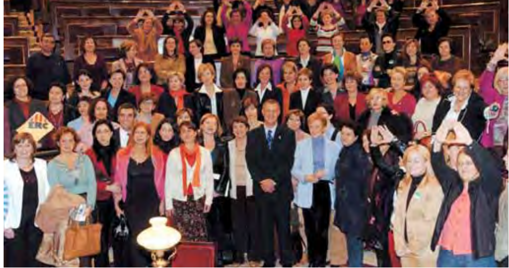
El ministro de Trabajo y Asuntos Sociales junto a las diputadas tras la aprobación del proyecto de ley en el Congreso

Las medidas de apoyo a las víctimas se establecen en cuanto al derecho a la información y a la asistencia social integrada y a la espe-