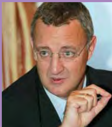
MINISTRO DE TRABAJO Y ASUNTOS SOCIALES

Yo hago un balance positivo. Las políticas sociales son una seña de identidad de este Gobierno, probablemente la más importante. Y buena prueba de ello, es que las medidas no son coyunturales. Son medidas de fondo que se han adoptado desde que estamos en el Gobierno y tengo que decir con satisfacción que, prácticamente, todas ellas han sido avaladas por unanimidad por el Parlamento. Por ejemplo, la ley para prevenir la violencia que se ejerce hacia la mujer y la subida del salario mínimo interprofesional, obtuvieron un apoyo unánime. Los Presupuestos del Ministerio han sido bastante bien valo-