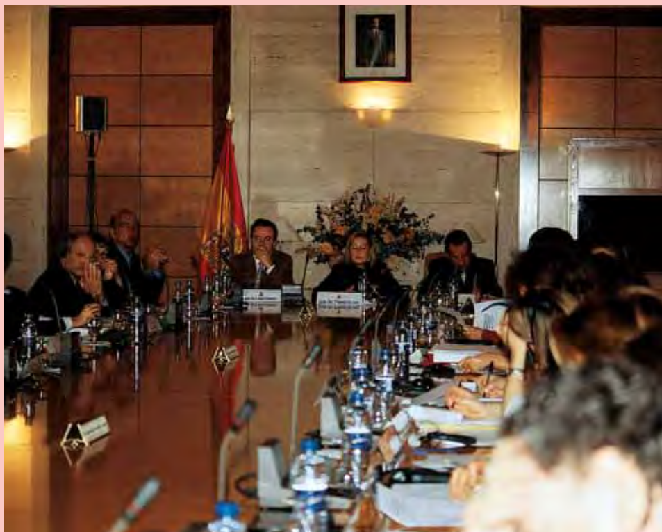
En la reunión celebrada en el IMSERSO, estuvo presente la secretaria de Estado de Servicios Sociales, Familias y Discapacidad, Amparo Valcarce.

– Se introducen nuevos requerimientos para la formación de los profesionales en una amplia variedad de sectores (justicia, urbanismo, educación, organización del trabajo...). Los trabajos de este Seminario se han centrado en la formación de los profesionales vinculados a los sistemas de salud y bienestar. Sin embargo, el avance en la participación, la salud y la seguridad de las personas mayores reclama la implicación de otros sectores y agentes que no han sido tratados en este Seminario, tales como los medios de comunicación, los sindicatos, las asociaciones de empresarios, y los funcionarios y directivos del sector público.