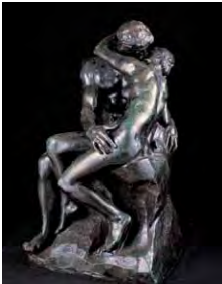
“El beso. 1882”. Bronce.

después de la Primera Guerra Mundial, en uno de los temas predilectos de los escultores.