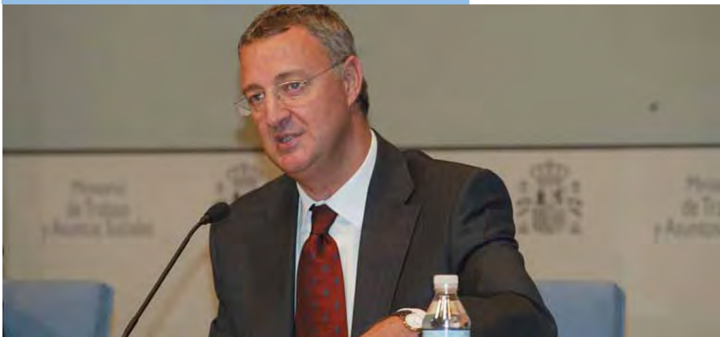
Jesús Caldera informó sobre la subida de las pensiones para el 2005.

E l Gobierno destinará 936 millones de euros para compensar a los perceptores de pensiones, mediante una paga única a principios de año, para compensar por el desvío de los precios. Mientras que destinará la misma cantidad para consolidar este aumento en sus nóminas mensuales a lo largo de 2005.