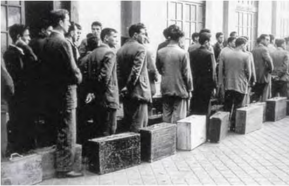
Millones de españoles emigraron en busca de trabajo y oportunidades.