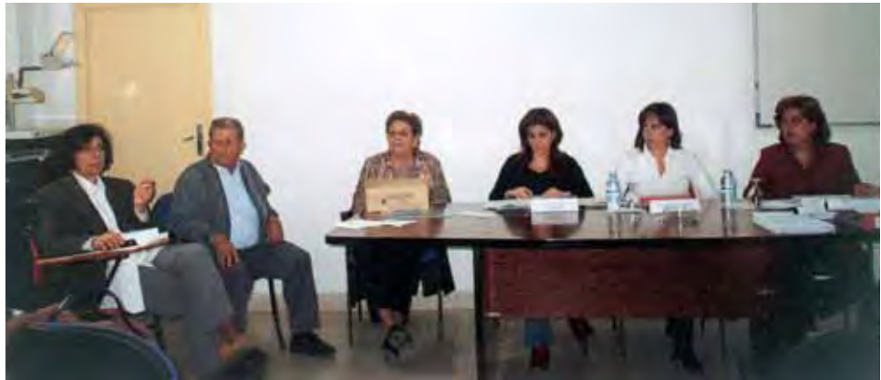
Parte de la junta directiva de la AMER durante una reunión.