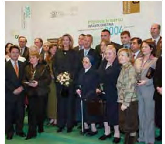
18-23 A Fondo