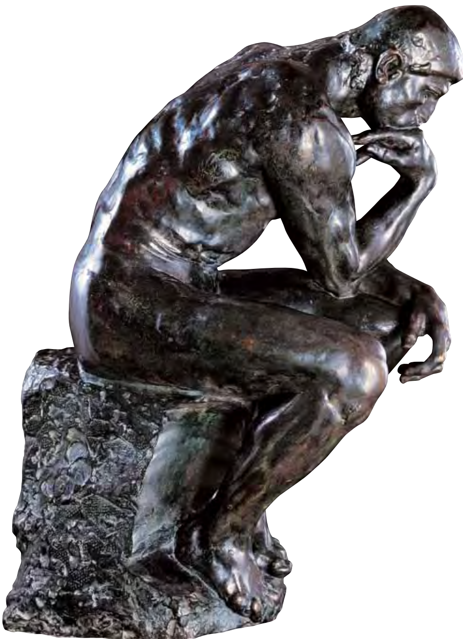
“El pensador, 1881-1882”. Bronce. August Rodin. Museo Rodin, París.

El lenguaje escultórico del siglo XX tiene su punto de partida en August Rodin, extraordinario escultor, que reafirmó definitivamente lo que Rembrandt había definido como derecho propio del artista: el declarar terminada la obra cuando se han alcanzado los objetivos artísticos. A partir de él se introduce un elemento completamente nuevo: la discrepancia entre la pasión y la confusión de sentimientos, como fiel reflejo de la vida interior del creador.