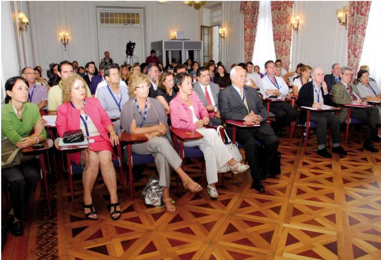
En el encuentro participaron un número importante de expertos del ámbito sociosanitario.