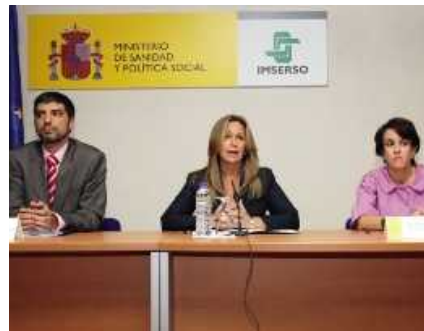
6/7 La Noticia