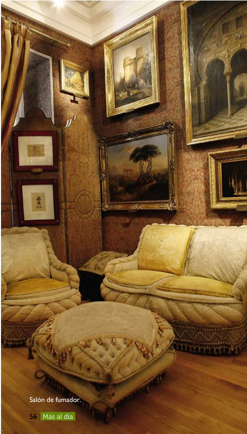
Salón de fumador.