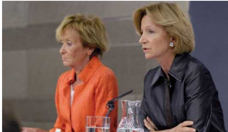
M a Teresa Fernández y Elena Salgado comparecen ante los medios después del Consejo de Ministros.

Son, por tanto, unos presupuestos austeros, que desarrollan las medidas de ajuste planteadas en el Plan de Revisión del Gasto de la Administración General del Estado 2011-2013, aprobado en mayo pasado; pero que también optimizan la eficiencia en el uso de los recursos públicos para, apoyándose en el proceso de reformas estructurales puesto en marcha en los últimos meses, contribuir a la recuperación de la economía española. Persiguen, por tanto, dos objetivos complementarios: la reducción del déficit, como prioridad en el corto plazo; y el incremento de la competitividad