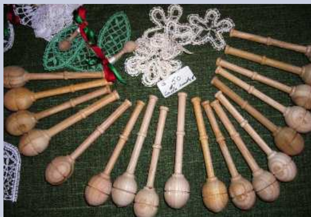
Utensilios para aprender a palillar.

empezar deben de hacerse con una almohada ligera de tamaño inferior al normal. Y con seis pares de palillos irán pasando de paño en paño, pero con mucha paciencia irán aumentando los palillos. Estos se contarán siempre en pares. Nadie trabaja con cien palillos sino con cincuenta pares. Y lo primero que debe de aprender el aspirante es a manejar los palillos y saber coger el ritmo e ir poco a poco aprendiendo a entrecruzar los hilos. Dejar de mi-