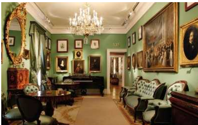
Sala de tertulia.