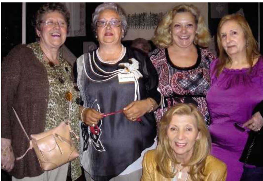
Asociación de palilleiras de La Coruña.